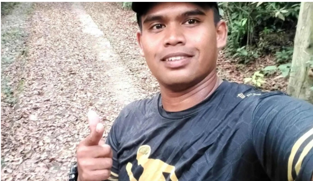
Hutan rekreasi sungai udang katalog