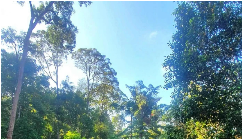
Hutan rekreasi sungai udang diskaun