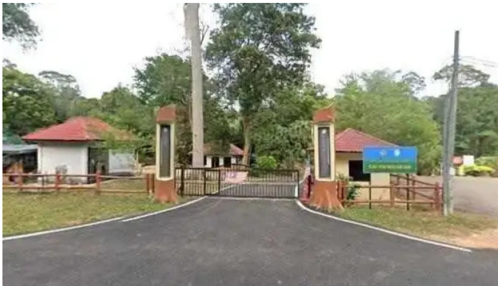
Hutan rekreasi sungai udang street view 360deg