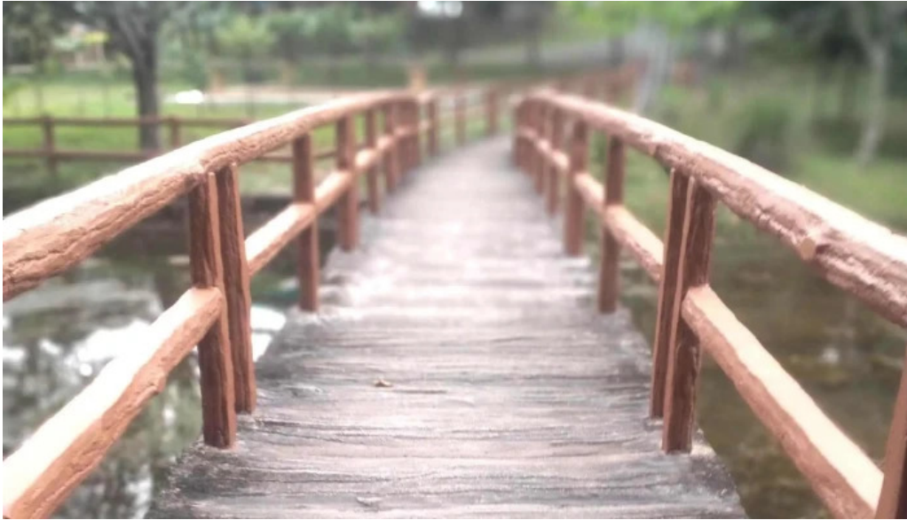
Hutan rekreasi sungai udang ulasan