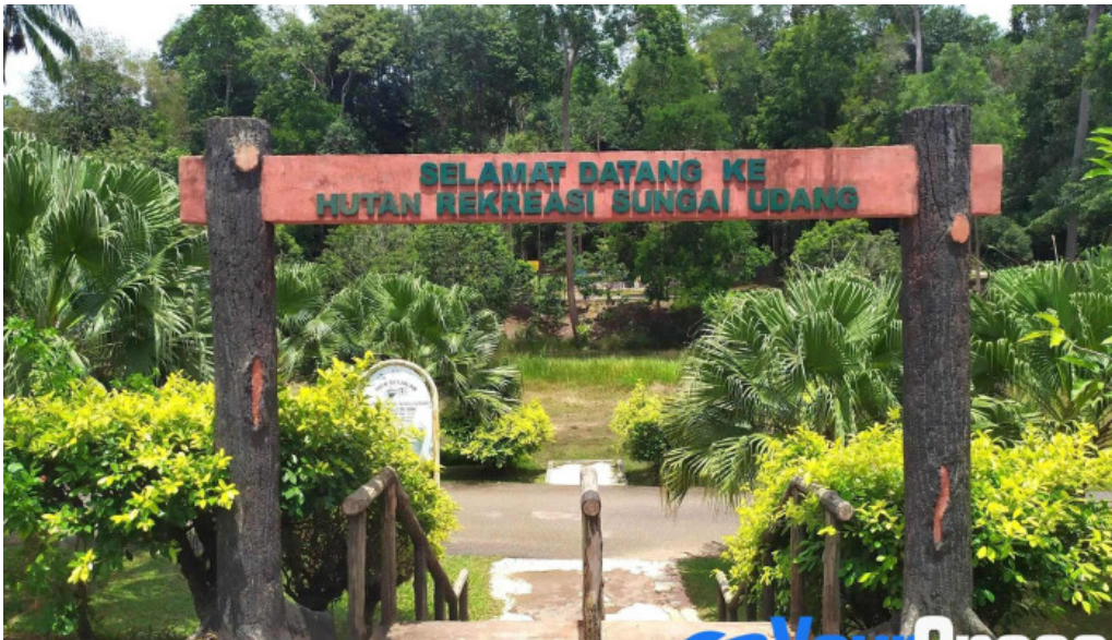
Hutan rekreasi sungai udang kawasan pemuliharaan alam semula jadi