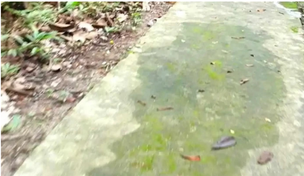
Hutan rekreasi sungai udang video