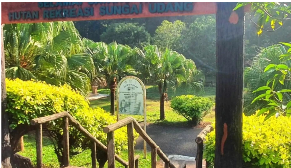
Hutan rekreasi sungai udang sungai udang