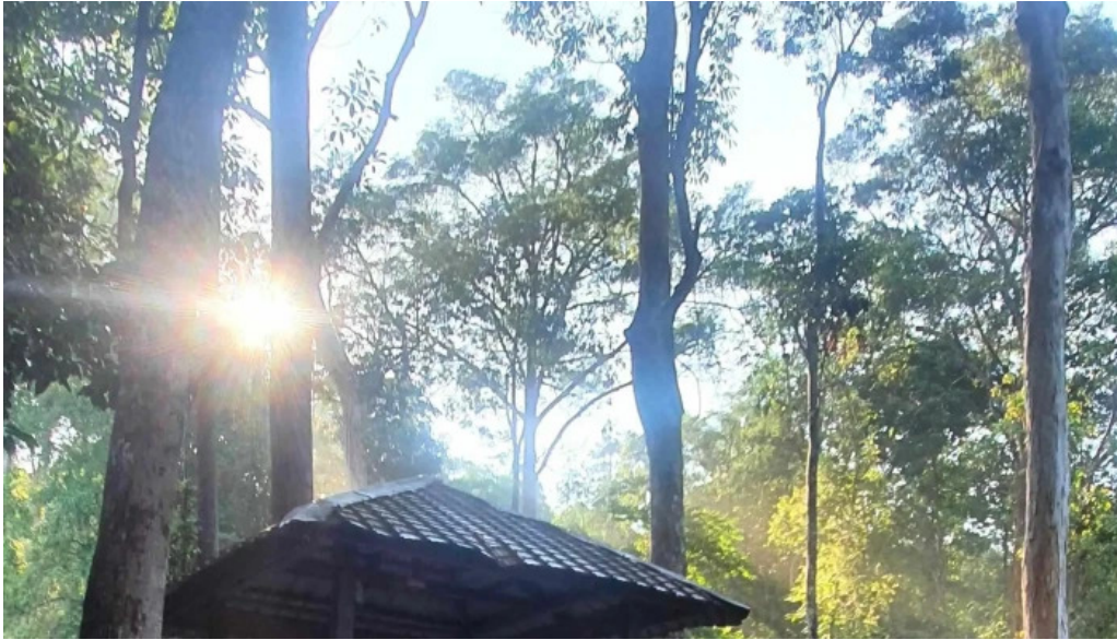
Hutan rekreasi sungai udang foto