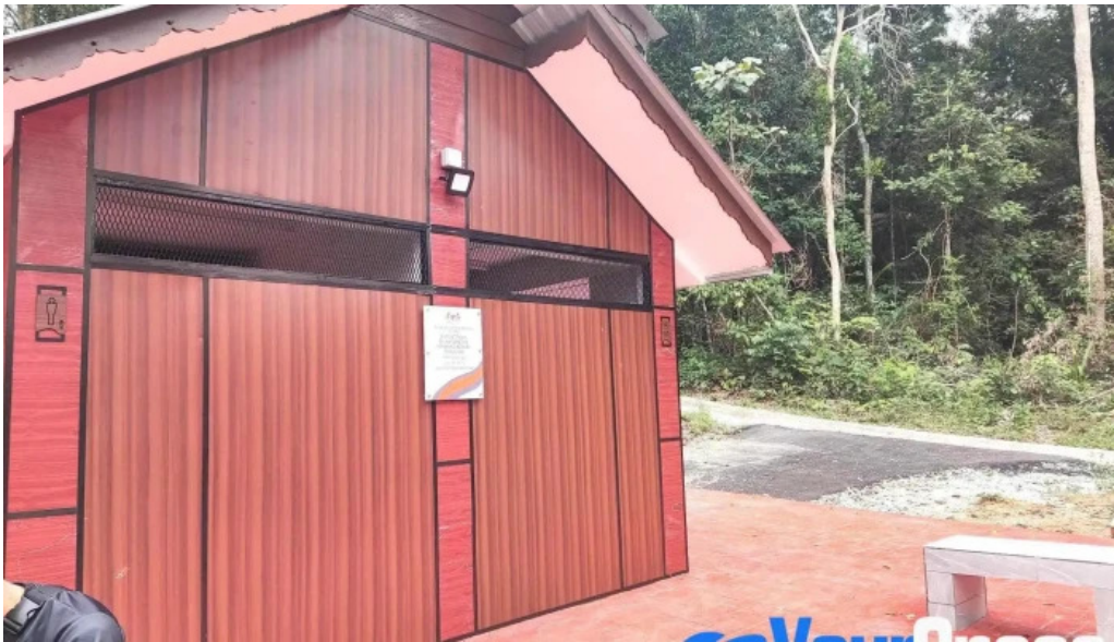
Hutan rekreasi sungai udang terkini