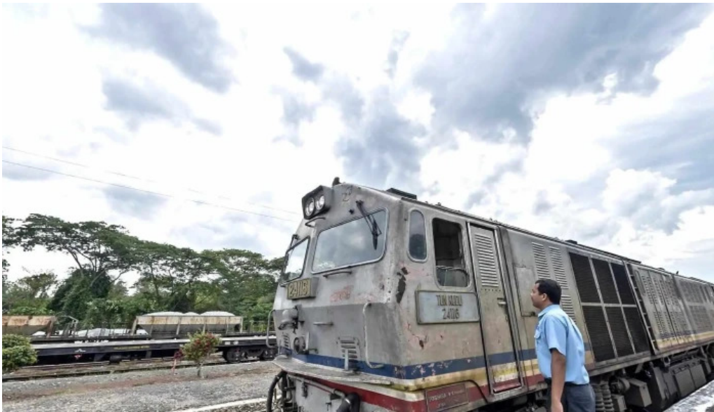
Stesen ktmb pulau sebang tampin street view 360deg