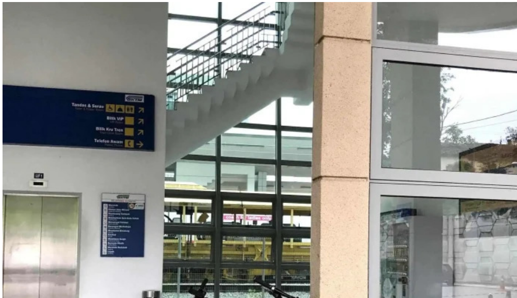
Stesen ktmb pulau sebang tampin alamat