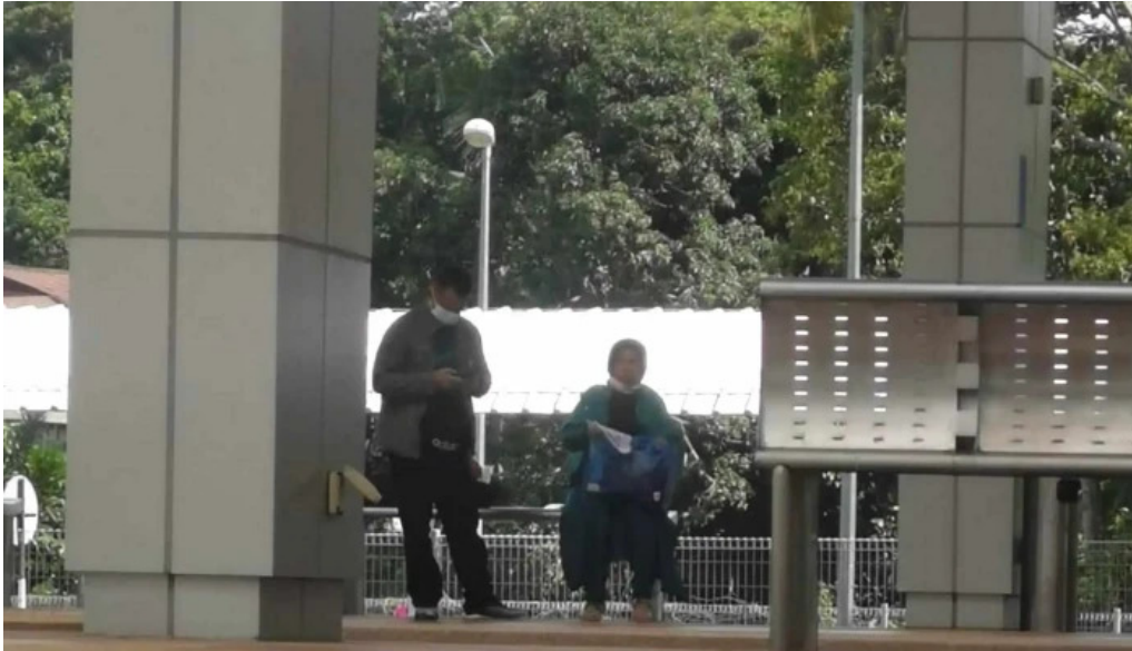
Stesen ktmb pulau sebang tampin video