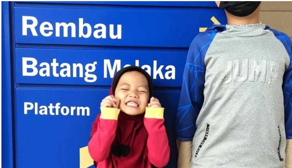
Stesen ktmb pulau sebang tampin cara ke sana