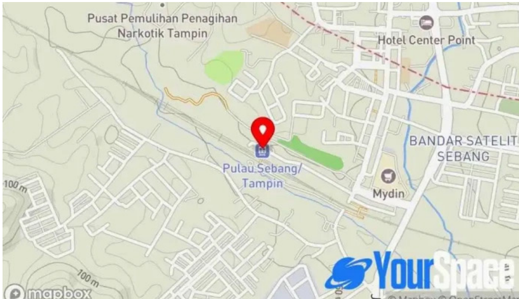
Stesen ktmb pulau sebang tampin peta