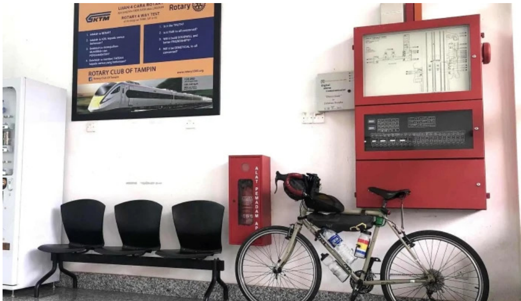
Stesen ktmb pulau sebang tampin kawasan