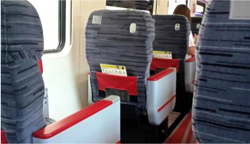
Stesen ktmb pulau sebang tampin tampin