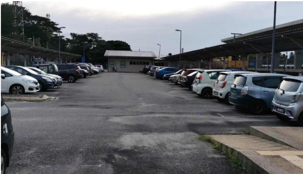
Stesen ktmb pulau sebang tampin katalog