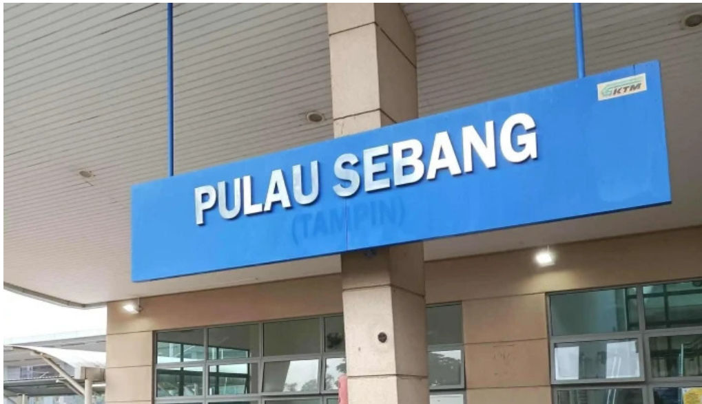
Stesen ktmb pulau sebang tampin berdekatan saya