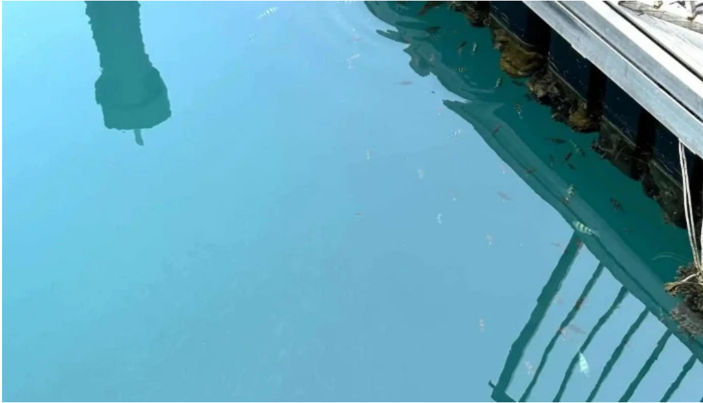
Pantai kampung tekek katalog