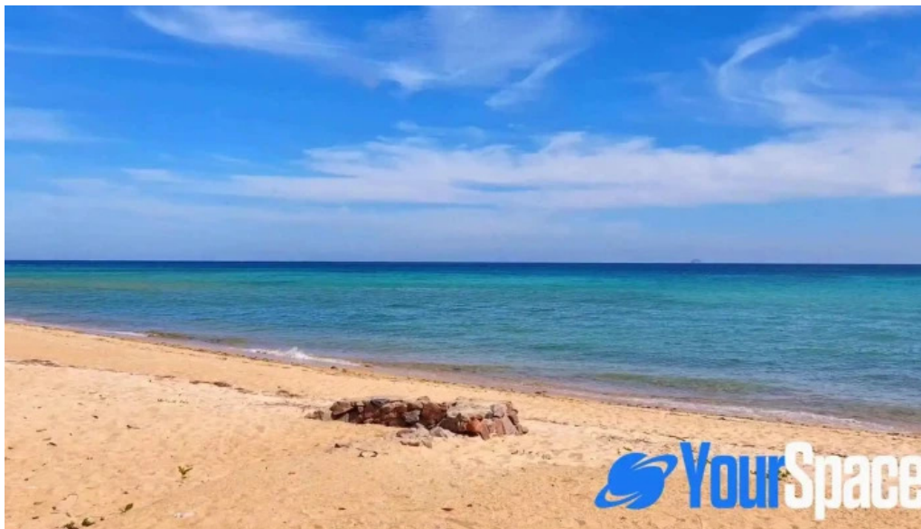
Pantai kampung tekek pantai