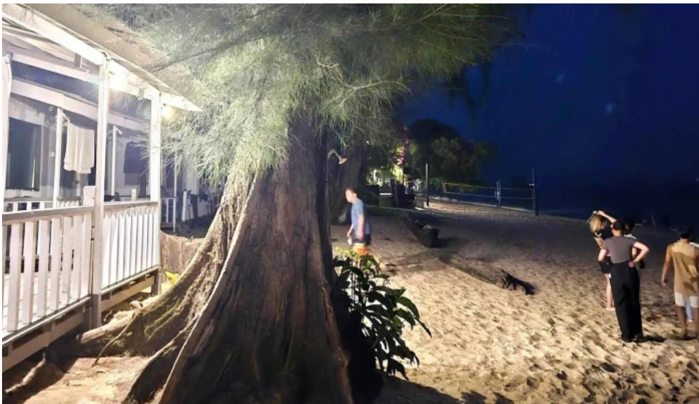
Pantai kampung tekek ulasan