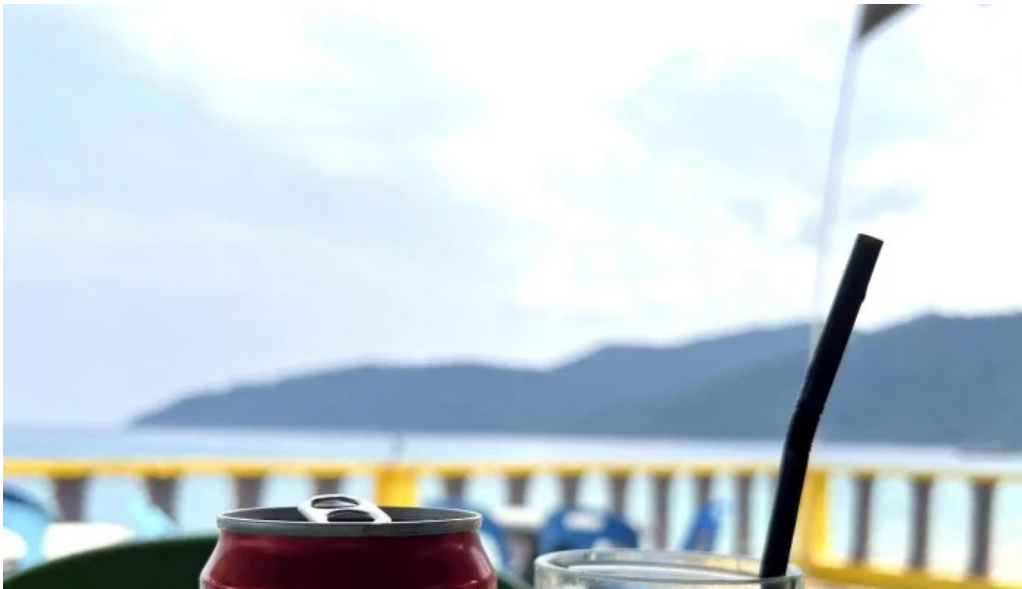
Pantai kampung tekek promosi