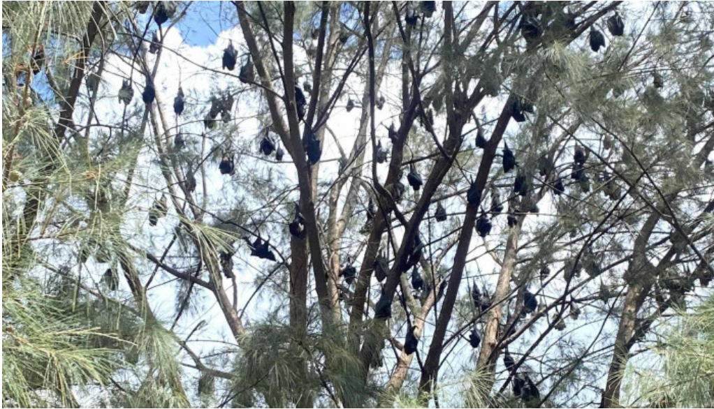
Pantai kampung tekek nombor