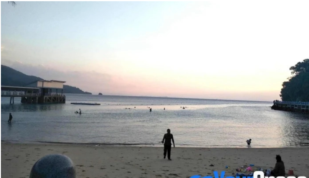
Pantai kampung tekek matahari terbenam