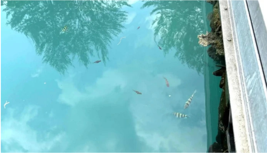
Pantai kampung tekek video