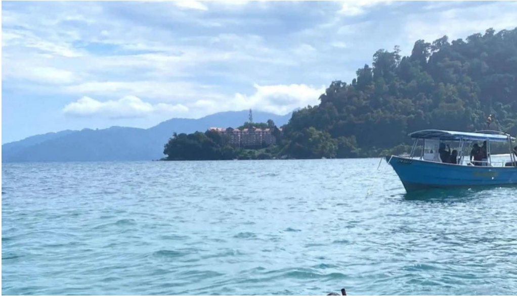
Pantai kampung tekek pulau tioman