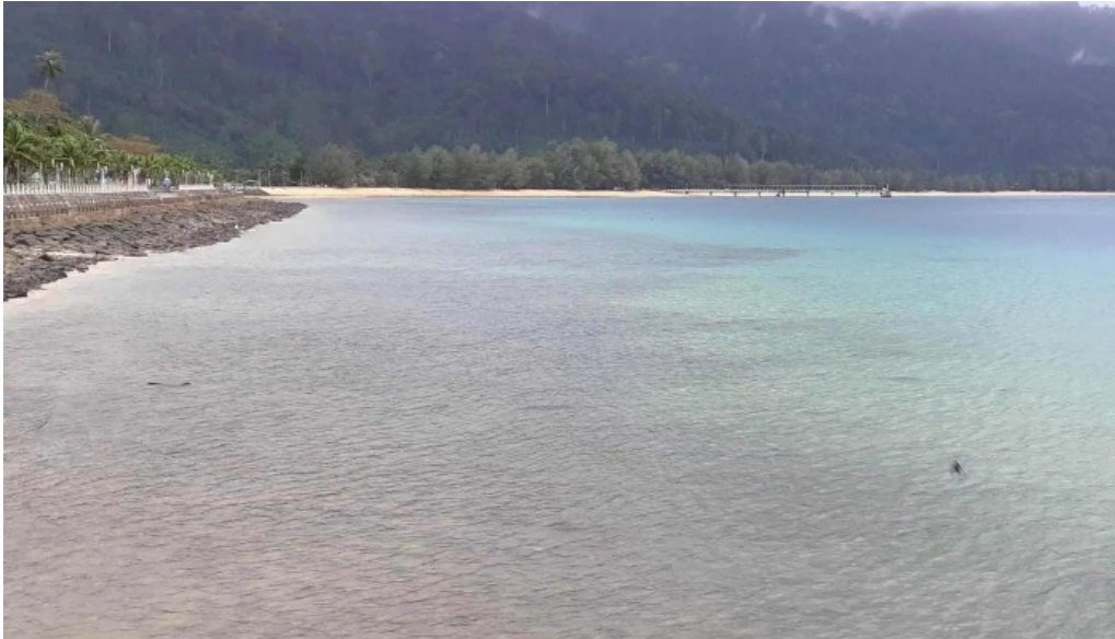
Pantai kampung tekek telefon