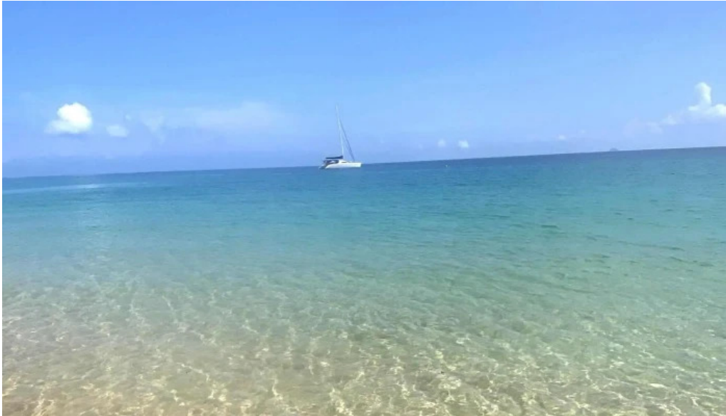
Pantai kampung tekek di mana