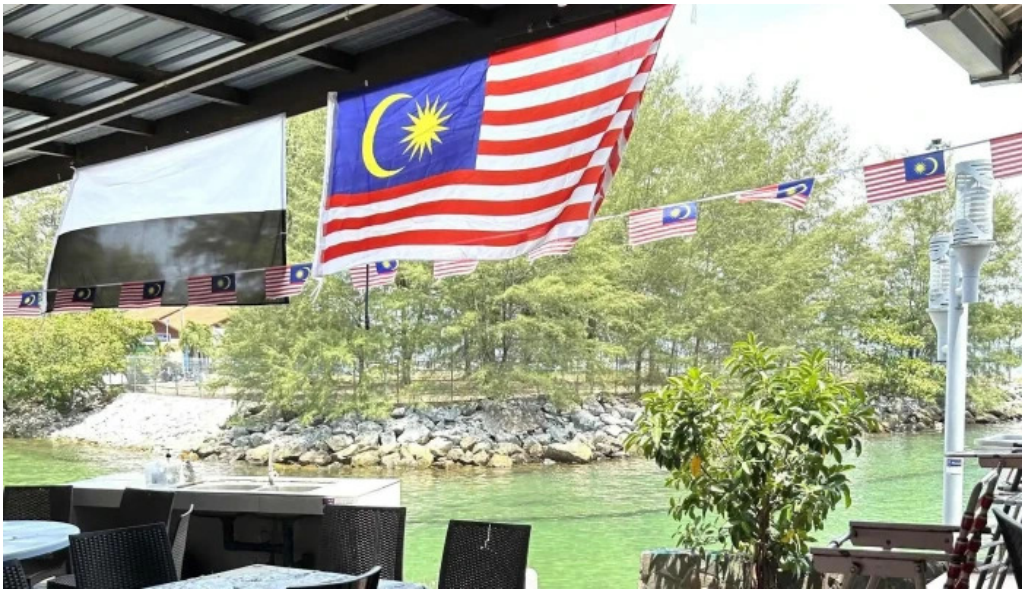
Pantai kampung tekek harga