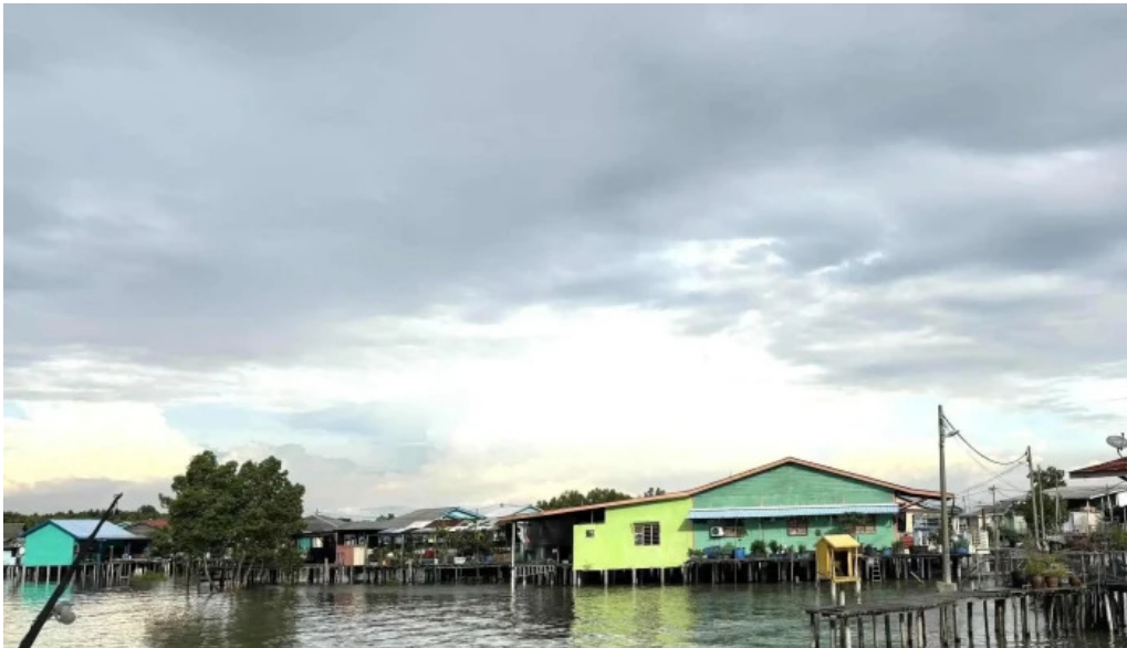
Pulau ketam video