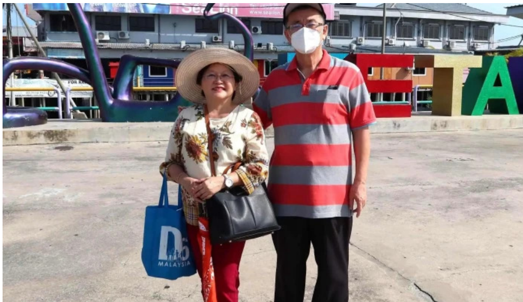
Pulau ketam foto