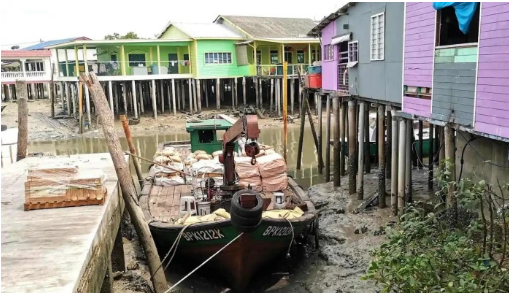
Pulau ketam pulau