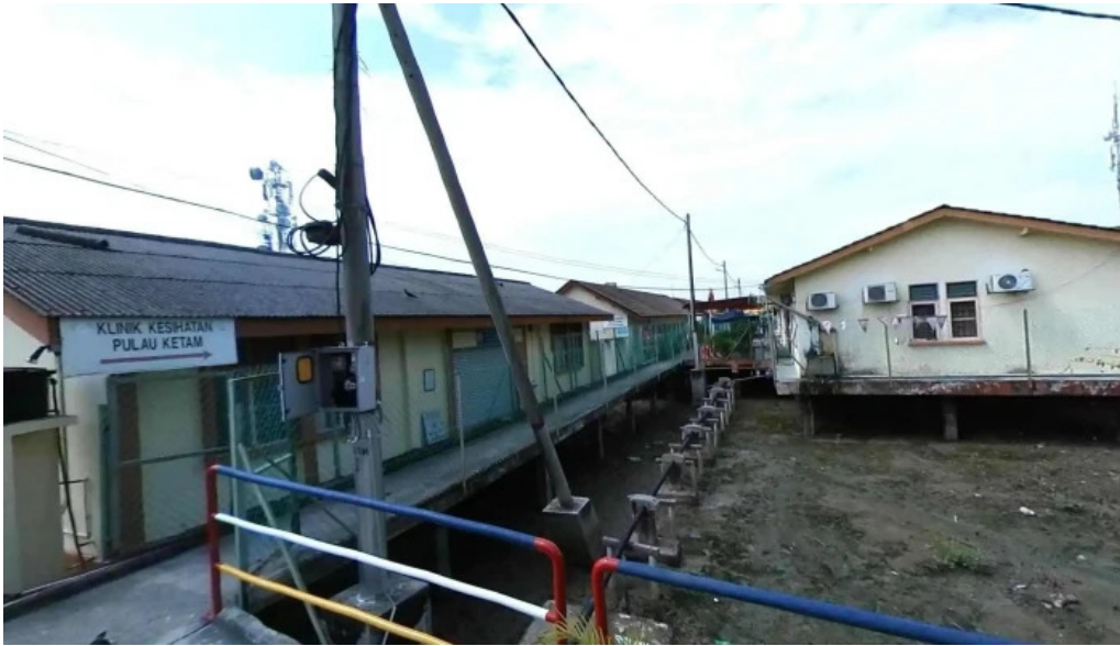
Pulau ketam street view 360deg