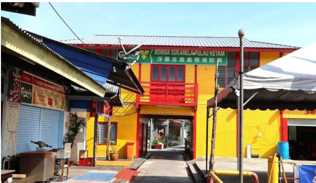
Pulau ketam skor