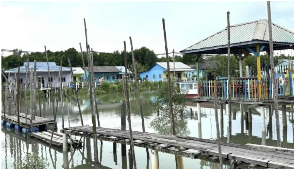
Pulau ketam laman web