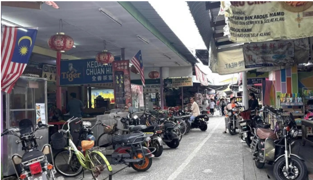
Pulau ketam pulau ketam