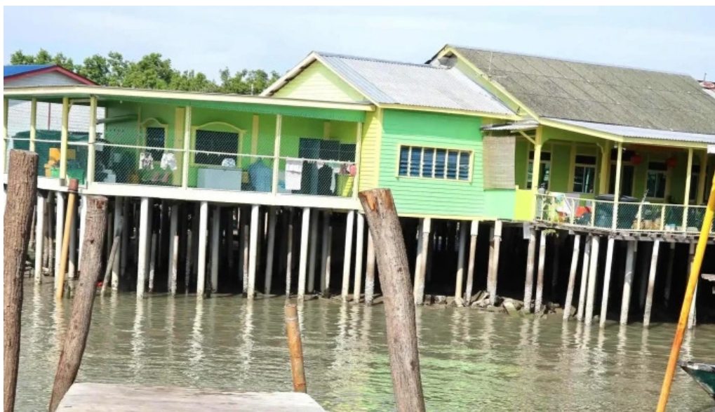
Pulau ketam di mana