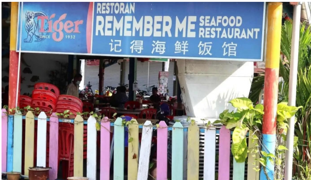
Pulau ketam kawasan