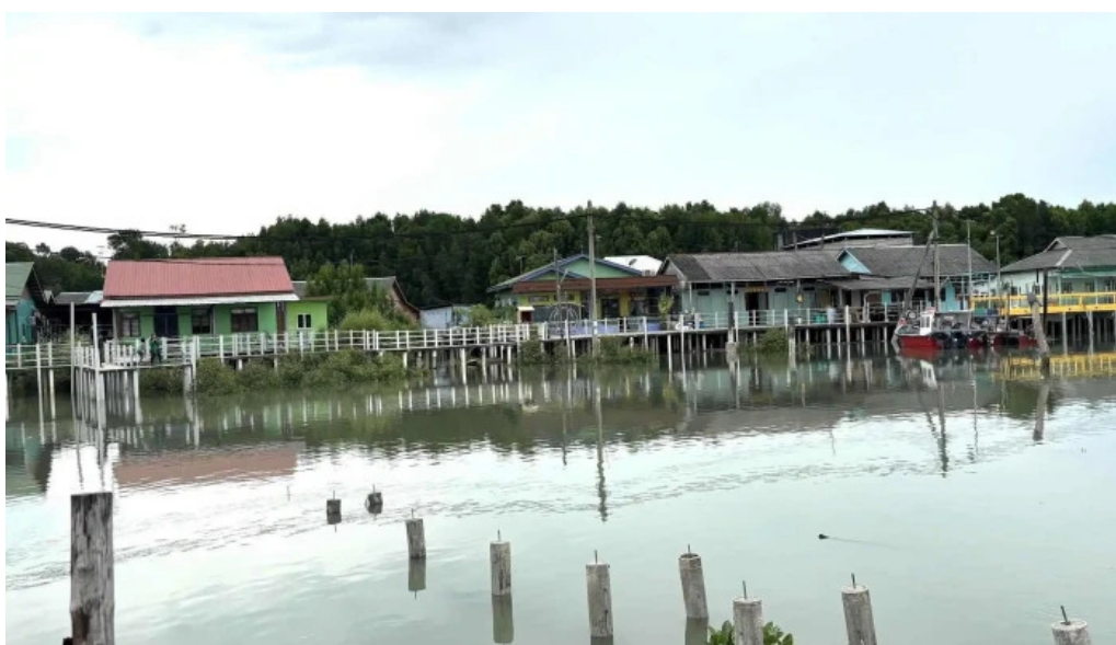
Pulau ketam berdekatan saya